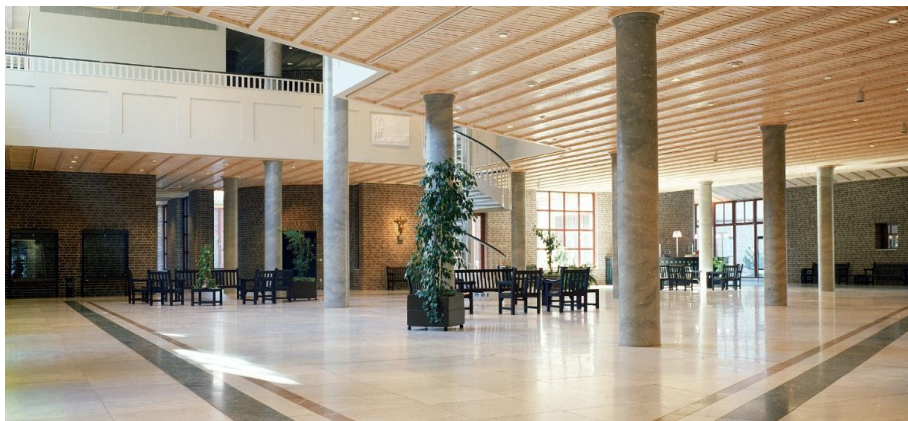
Foyer / Ausstellung