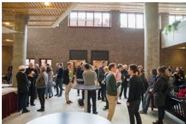
Pause im Foyer Maternushaus

Firmen-Workshop am 1. Juni 2024 € 1.000,- netto